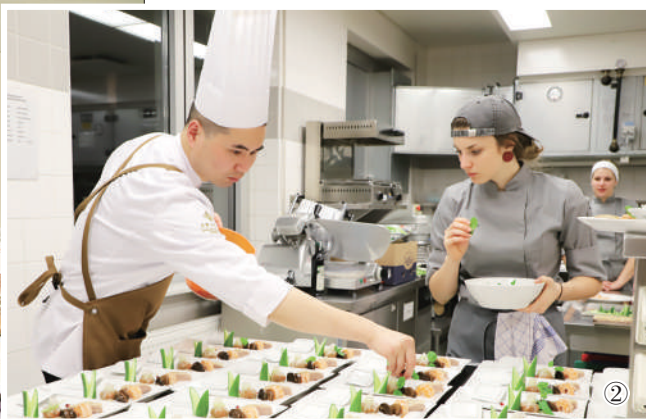
“施泰尔马克遇见中国”中奥厨艺比拼活动在奥地利举办

11月20日,由奥地利格拉茨孔子学院和奥地利施泰尔马克州高等教育学院共同举办的“施泰尔马克遇见中国”中奥厨艺比拼活动在奥地利格拉茨拉开帷幕,来自南京金陵滨江酒店的淮扬菜名厨和来自奥地利的厨师共同完成菜品。